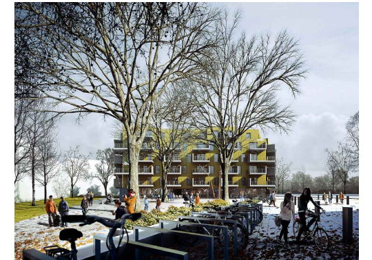
Visualisierung der Westfassade