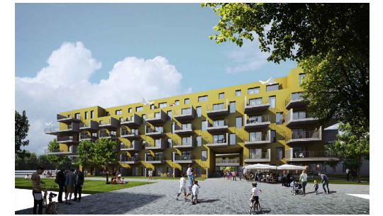
Visualisierung der Ostfassade