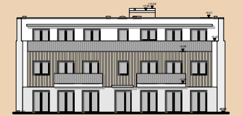
Ansicht Süden vom Innenhof - Bauteil 3