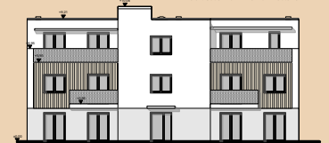
Ansicht Norden von der Stadtmauer - Bauteil 3